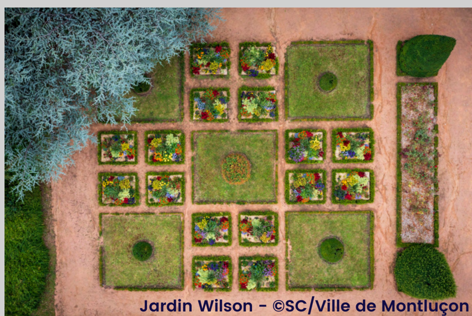
Jardin Wilson

Servant d'écrin à la Villa Louvière dans l'inspiration du Petit Trianon de Versailles, ce parc est un joli compromis entre jardin à la française et parc à l'anglaise. Il abrite une grande variété d'essences végétales, mais aussi de très nombreux éléments de décoration (fontaine Wallace, sculptures, bassin) et même une volière !