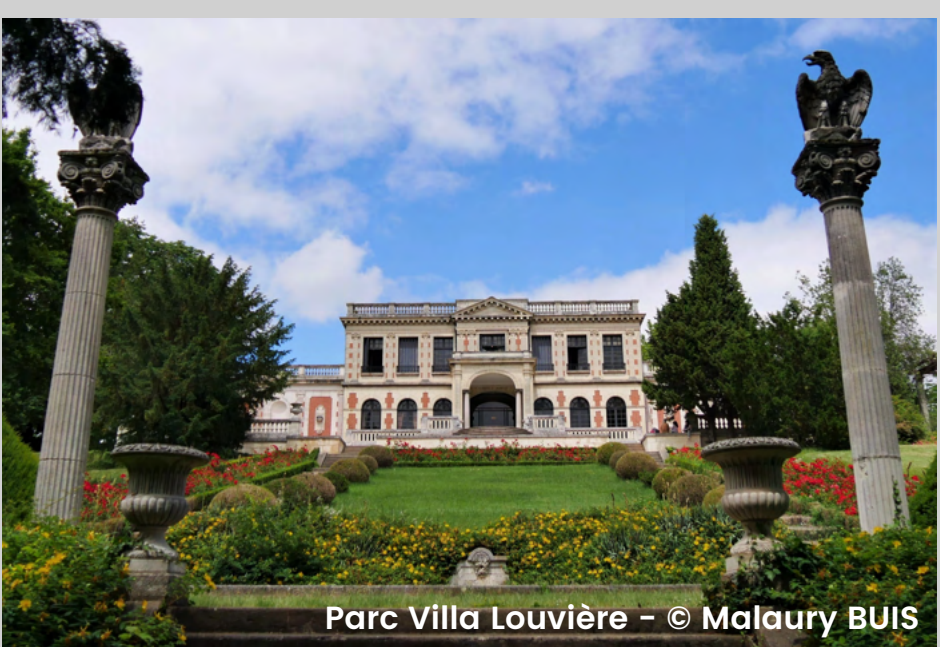
Parc Villa Louvière