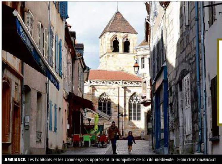
AMBIANCE. Les habitants et les commerçants apprécient la tranquillité de la cité médiévale.

« On a eu de la chance que la place Saint-Pierre redevienne piétonne ce qui lui donne un air de village. On ne subit pas le bruit et la pollution du boulevard. On est dans l'endroit de Montluçon où il y a le plus de