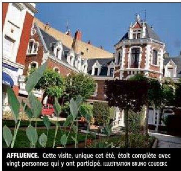
AFFLUENCE. Cette visite, unique cet été, était complète avec vingt personnes qui y ont participé. ILLUSTRATION BRUNO COUDERC

2 Le Grenier à sel en était un véritable. Au XVI e siècle, le bâtiment qui abrite maintenant un hôtel-restaurant, était utilisé