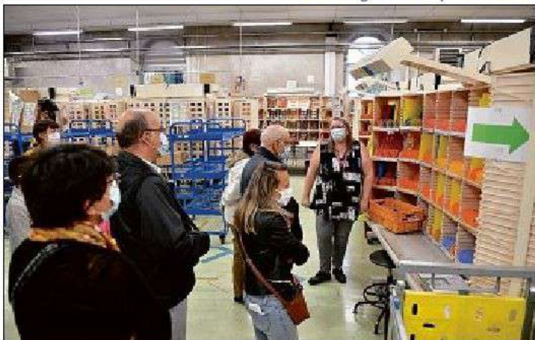
TOURISME. La Poste de Montluçon a ouvert ses portes, hier, à l'occasion des coulisses des métiers.

« Depuis la réorganisation d'octobre 2019, on traite le courrier de Domérat et de Montluçon »,