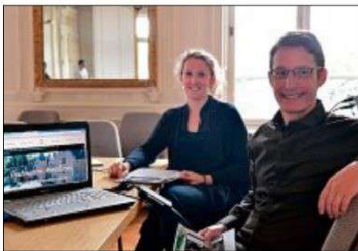
LIFTING. Après dix-huit mois de développement, le nouveau site de l'Office de tourisme ( www.valleecoeurdefrance.fr) a été mis en ligne le 26 mars dernier.