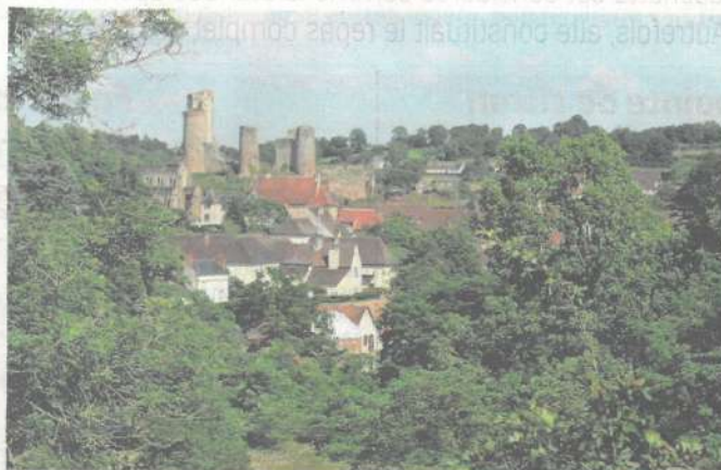
La cité médiévale de Hérisson offre un voyage dans le temps qui réserve son lot d'anecdotes et de découvertes.

Tous les mercredis jusqu'au 12 août : rendez-vous à 09h30 devant l'Office de